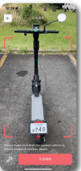
返却は必ず駐車ステーションへ 返却。終了時は、駐車状況を写真に撮り アップロードしてライド終了。