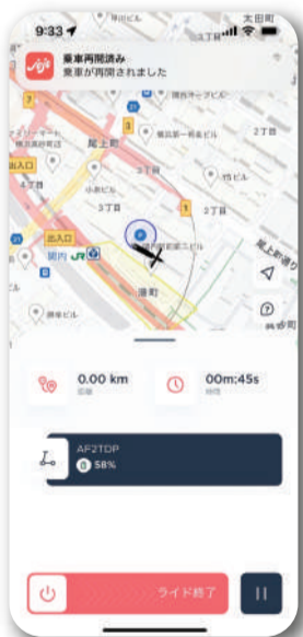
初めてご利用の際は 道交法テスト。答案あり。