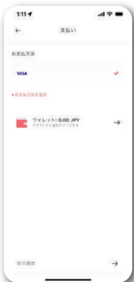
決済方法の登録 (クレジットカード登録)