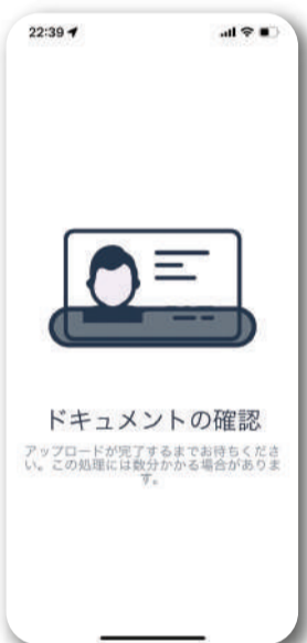
自撮り写真による 券面との自動確認