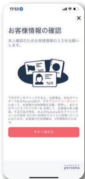
免許証等本人確認書類 アップロード