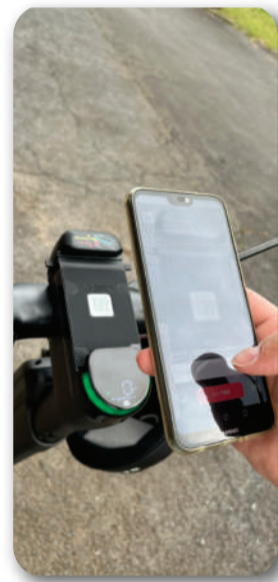
本体の二次元バーコード 読み取り