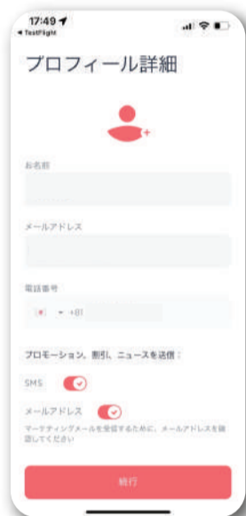
ユーザー情報登録 (名前 電話番号)