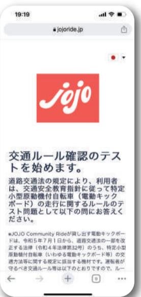
解錠してスタート、一時停止ボタン機能で レンタル中も施錠可能